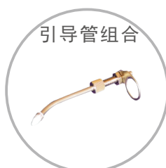
出锡导管组件（带手动开关）