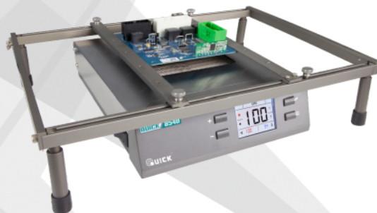
应用场景：可升降支架