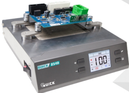
应用场景：磁吸式支架