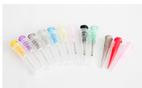
多款针头可供选择