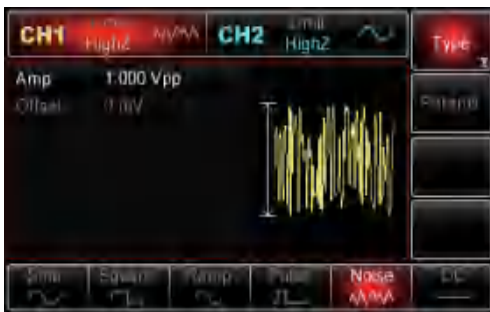
固定带宽为60MHz的噪声信号