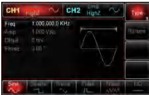
双通道有多种基本波形可选择